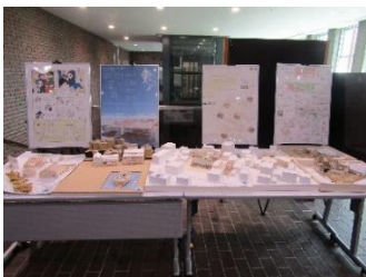
明石工業高等専門学校建築学科卒業作品展示