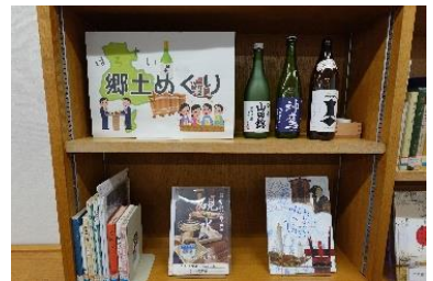
ほろよい郷土めぐり