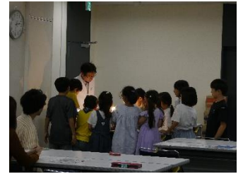
光のミラクルサイエンス教室