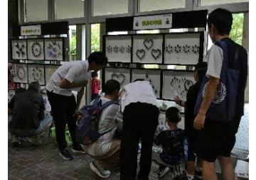
「ゆめはく号」での標本展示