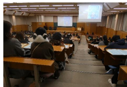
ビブリオバトル兵庫県大会 決勝