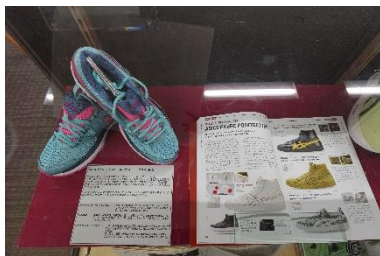
マラソンの歴史とランナーを支えるランニングシューズ