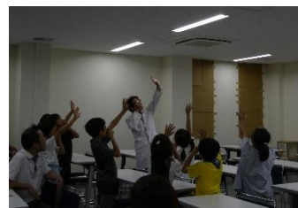
光のミラクルサイエンス教室