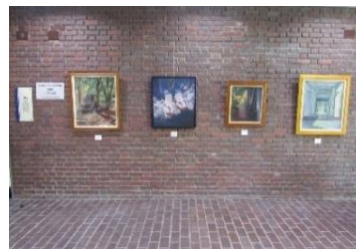
明石高校の美術部の作品のロビー展示