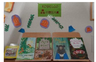
第12回 KOBELCO 森の童話