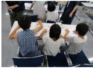
ワークショップで絵を描く子どもたち