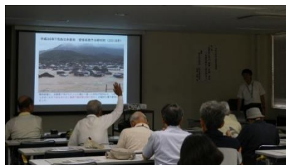
気象庁と学ぶ前線・台風・洪水 ー気象災害から身を守るー