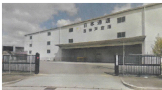
3階建のうち2, 3階(約 2,500 m 2 )を使用