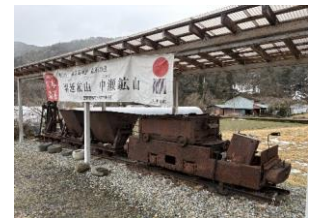
中瀬鉱山トロッコ列車