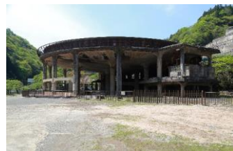
神子畑選鉱所跡シクナー